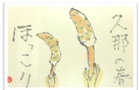
久那公民館に講師の作品を掲示中